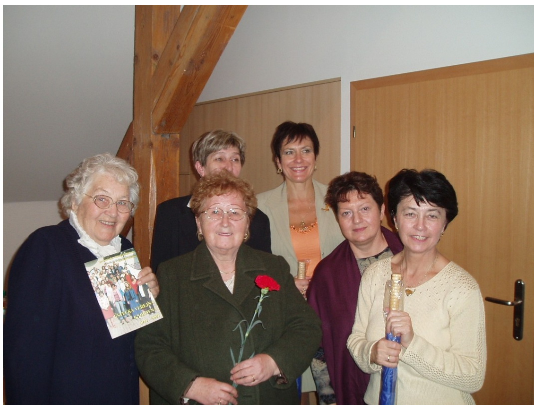
Oslav šedesáti let knihovny se zúčastnila řada bývalých i současných zaměstnanců