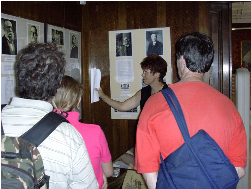
V rámci Dnů evropského dědictví byla o dvou zářijových víkendech otevřena i budova ve V. hradební